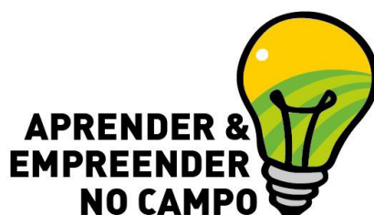
Figura 2 | Logotipo do Projeto Aprender e Empreender no campo

Foram realizadas reuniões entre os membros da equipe, via meet, para organizar as atividades a serem realizadas. A elaboração de um logotipo como identidade visual do projeto foi a primeira ação. De posse do logotipo elaborou-se um folder de divulgação do Projeto na comunidade e também foi dada uma entrevista na rádio Ibiá. As reportagens realizadas sobre o Projeto podem ser acessadas nos links abaixo: a reportagem no Jornal Ibiá - https://jornalibia.com.br/montenegro/interior/inovacao-para-manter-os-jovens-na-agricultura/ e a outra na TV Monte - https://fb.watch/dO5EMnwF5v/ .