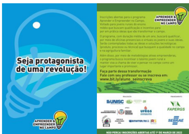
Figura 3 | Folder de Divulgação do Projeto