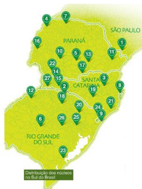
Figura 1: Localização dos núcleos da Rede Ecovida

Atualmente a rede conta com 27 núcleos regionais, abrangendo cerca de 352 municípios (Figura 1). Seu trabalho congrega, aproximadamente, 340 grupos de agricultores (abrangendo cerca de 4.500 famílias envolvidas) e 20 ONGs. Em toda a área de atuação da Ecovida, acontecem mais de 120 feiras livres ecológicas e ainda outras formas de comercialização. É formada por agricultores familiares, técnicos e consumidores reunidos em associações, cooperativas e grupos informais, juntamente com pequenas agroindústrias, comerciantes e pessoas comprometidas com o desenvolvimento da agroecologia. Nem todos os núcleos têm gestão realizada pelos próprios produtores, a maioria ainda depende de instituições apoiadoras para realizar a gestão.