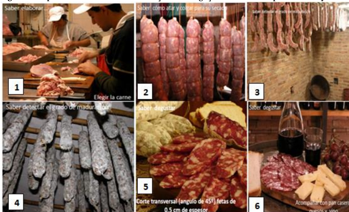
Figura 3: Aspectos envolvidos na elaboração e divulgação do Salame Típico de Caroya